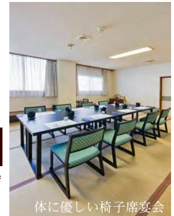
体に優しい椅子席宴会

※ 貸切風呂営業時間は 17:00~21:30 まで。チェックイン後ご案内可能です。(事前予約不可) またホテル判断により男性用共用風呂として営業する日もございます。