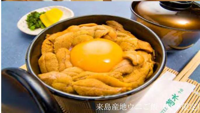
来島産地ウニご飯(季節限定)