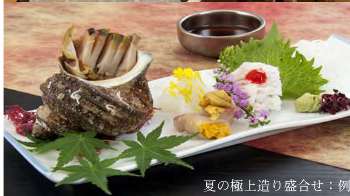
夏の極上造り盛合せ:例