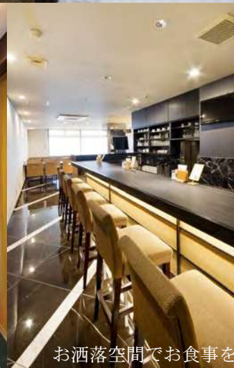
お洒落空間でお食事を