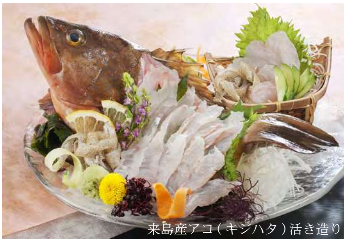
来島産アコ(キンハタ)活き造り