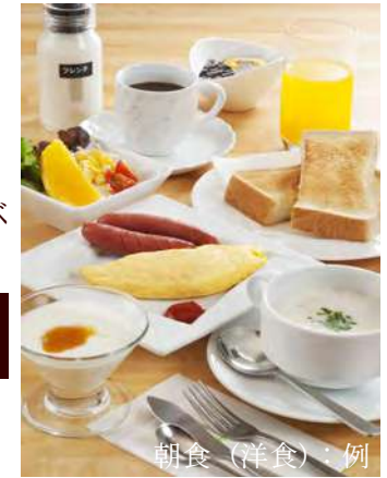
朝食 (洋食) : 例